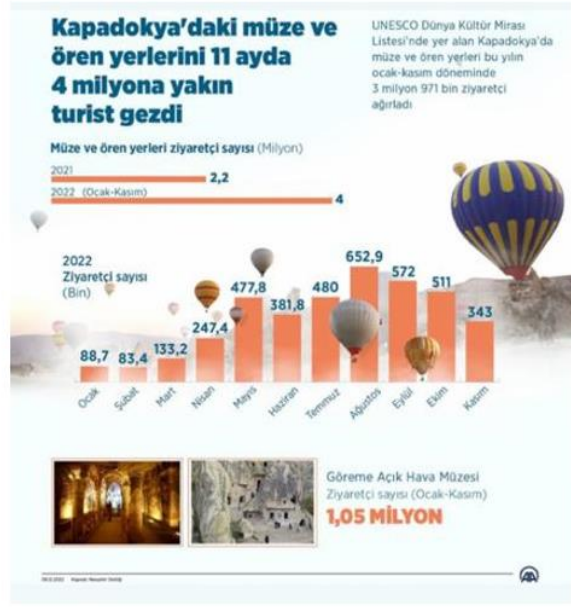
Şekil 1. Müze ve Ören Yerlerinin Ziyaretçi Sayısı